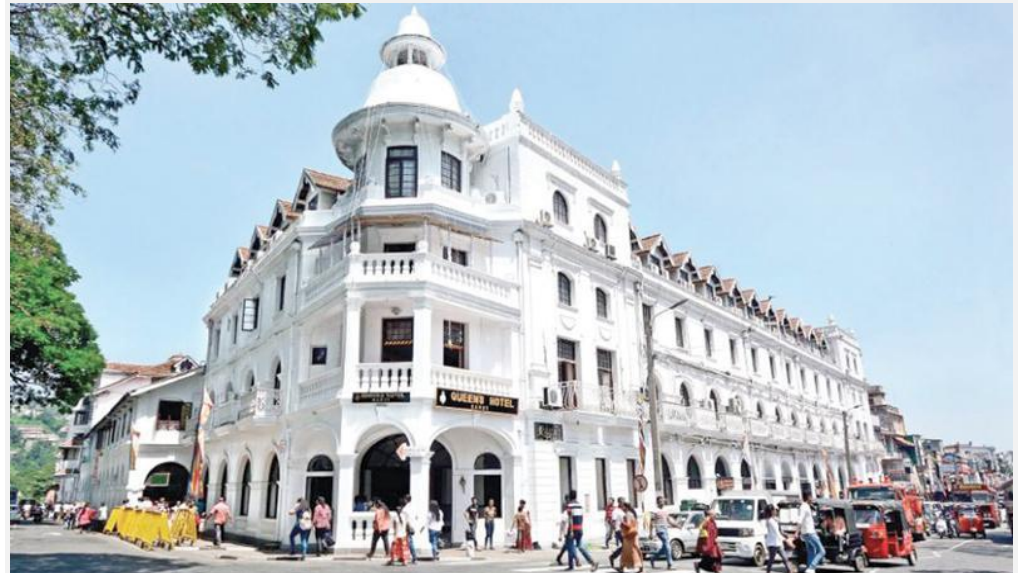
QUEENS HOTEL situé au cœur de Kandy