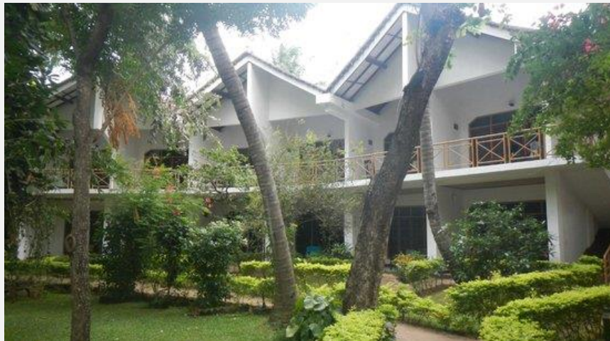
PELWEHERA VILLAGE RESORT