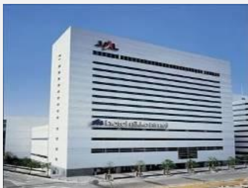
NIKO HOTEL ***