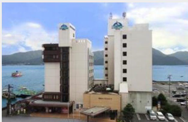
CORAL HOTEL ***