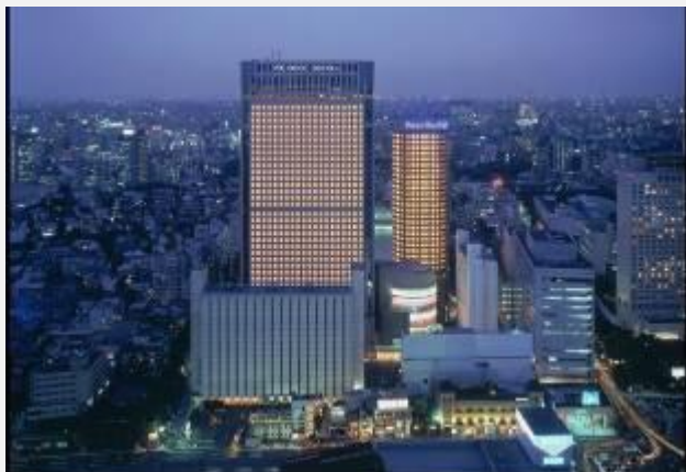
SHINAGAWA PRINCE TOWER ****