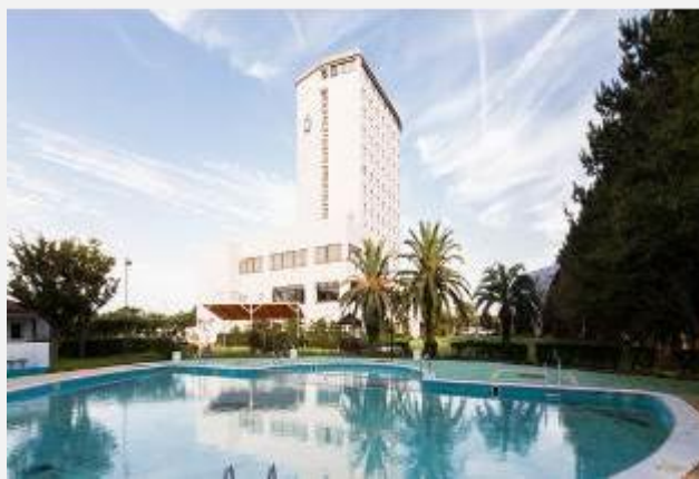
HOTEL HAMANAKO ROYAL ****