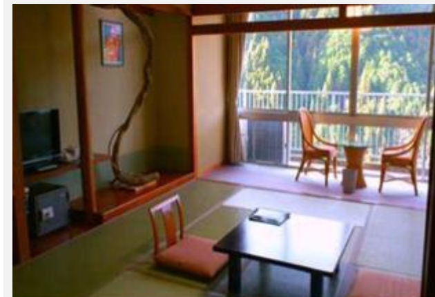
HOTEL MISUGI RESORT ***